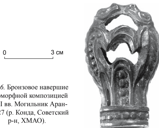
Рис. 6. Бронзовое навершие с зооморфной композицией X–XI вв. Могильник Арантур-27 (р. Конда, Советский р-н, ХМАО).

В завершение можно сделать еще один вывод о религиозных воззрениях жителей Надымского городка. Правда, основанный только на археологических источниках, он может показаться малоубедительным. Тем не менее обращу особое внимание на уникальную особенность культурного слоя Надымского городка – замерзшее состояние. Накапливаясь и замерзая, слой не оттаивал, и вещи в нем не перемещались. Именно это обстоятельство позволяет делать некоторые выводы не только по наличию артефактов, но и по их отсутствию. К категории культовых предметов и принадлежностей ритуалов в настоящее время отнесено ок. 200 изделий, и это не считая вещей из категории детских игрушек (ок. 1 500 экз.), в рамках которой сложно дифференцировать бытовые предметы и вотивные, а последние могут составлять не менее половины. Следы различ-