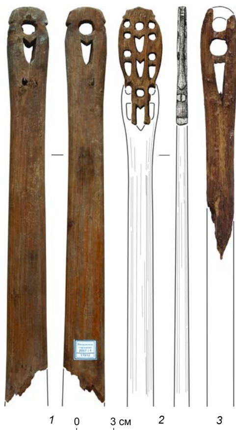
Рис. 3. Фрагменты посохов жреца из Надымского городка.

По фрагменту реконструируется посох в форме тонкой жерди овального сечения с ажурным зооморфным навершием (рис. 3, 1). Общий размер изделия определить невозможно. Верхняя часть имеет длину в пределах 8 см, ширину 3,5, толщину 1,4 см. В навершии с помощью двух сквозных отверстий переданы две сопоставленные фигуры животных: круглое формирует головы, полуовальное – лапы и туловище. Поперечными нарезками с наружной стороны изображений обозначены шея и короткие уши. Степень стилизации очень велика, видовую принадлежность изображенных животных к небольшим хищникам можно определить только по близости иконографии этих изображений к вышеописанным на посохе 1. Размер фигурок соответствует длине верхней части, определенной по сужению предмета до 2,8 \times 1,5 см. Ниже размер сечения увеличивается и у обломанного конца составляет 3,4 \times 1,9 см.