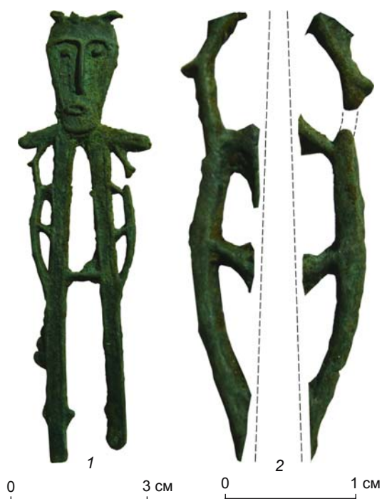
Рис. 5. Культовая антропоморфная скульптура из бронзы. Белоярская археологическая культура (VII–IV вв. до н.э.). Городище Стрелка (р. Большой Юган, Сургутский р-н, ХМАО). 1 – скульптура; 2 – ее зооморфные элементы – модель сопоставления фигурок зверьков.

Семантика подобных изображений достаточно подробно рассмотрена А. Голаном [1993, с. 160–163, рис. 340–359]. Если обобщить результаты его анализа, то подавляющее большинство парных сопоставленных фигур животных можно интерпретировать как элементы божественной триады, символизирующие стражей верховного божества (богини) или близнецов – детей верховной богини. Разнополюе фигурки в данном контексте олицетворяют идею божественного плодородия [Там же, с. 161–162]. Такая трактовка парных зооморфных изображений всецело согласуется с системой религиозных представлений коренных народов Сибири, взаимосвязанной с шаманской ритуальной практикой, в которой используется посох.