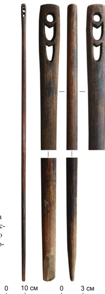
Рис. 2. Посох жреца из хозяйственной постройки 10 остяцкого квартала I Надымского городка.

Посох 1. Он представляет собой тонкую жердь овального сечения, увенчанную ажурным зооморфным навершием (рис. 2). Общая длина изделия 154 см. Для удобства описания посох условно разделен на три части. В верхней части с помощью трех сквозных отверстий переданы две сопоставленные фигуры животных: круглое формирует головы, полуовальные