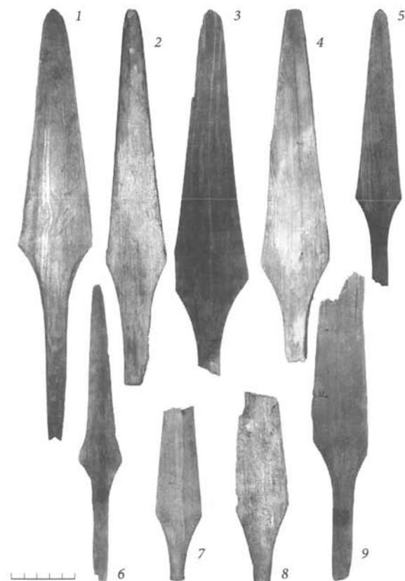
Рис. 3. Надымский городок 1–9 — деревянные модели наконечников копий с уплощенным насадом «черешковых» из слоя XVI — первой трети XVIII в.

Приведенные археологические и этнографические данные позволяют охарактеризовать позднесредневековые копья с уплощенным насадом как пред-