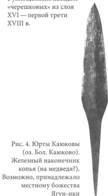
Рис. 4. Юрты Каюковы (оз. Бол. Каюково). Железный наконечник копья (на медведя?). Возможно, принадлежало местному божеству Ягун-ики